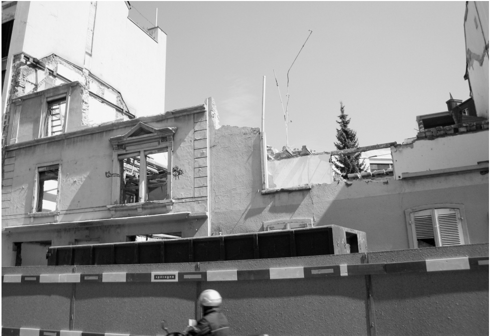
Juni 2008: Abbruch der alten Liegenschaften an der Grüngasse