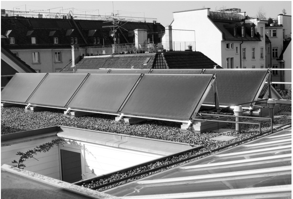
Die neue Solaranlage auf dem Dach der Brauerstrasse 75

Zur sozialen Orientierung gehörte der Grundsatz: Die Altbauwohnungen werden so erhalten, dass niemand sie aus finanziellen Gründen verlassen muss. Die ökologische Dimension verlangte ein Wärmesystem, das die Umwelt möglichst wenig belastet, gesundes Raumklima schafft und gleichzeitig beweist, dass sich das öko-nomisch auszahlt. Nach langen