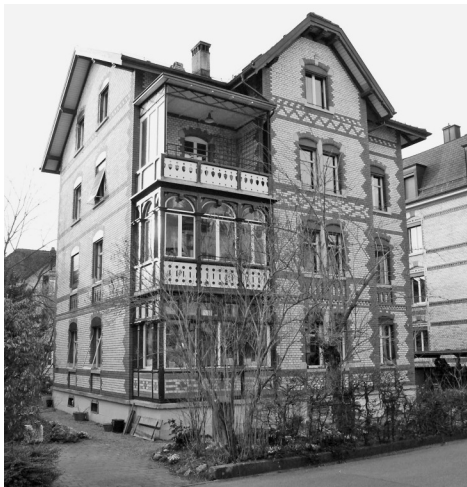
Die renovierten Wintergärten an der Falkenstrasse in Winterthur

An der Limmattalstrasse 285 und der Winzerhalde 9 wurden die bestehenden Gasheizungen ersetzt. An der Winzerhalde wurde für Warmwasserkollektoren auf dem Dach ein Baugesuch eingereicht. Die Stadt hat die Bewilligung mit Hinweis auf denkmalpflegerische Bedenken verweigert, ein Rekurs der Wogeno ist noch