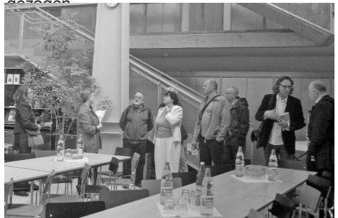
Der Wogeno-Vorstand trifft sich für die Besichtigung eines Bauprojekts in Basel.

Der Wogeno-Vorstand hat im Juni 2008 die Gesamtlage analysiert und ist zum Schluss gekommen, dass die Vereinbarung aus dem Jahr 2005 gescheitert ist. Den BewohnerInnen wurden sämtliche Gelder, die in den Jahren 2006-2008 in diesem Zusammenhang geüfnet wurden (freiwillige Einzahlungen in Erneuerungsfonds, Zahlungen strittiger Mieten) zurückgezahlt. Damit wurde ein Strich unter eine weitere Episode in dieser 22-jährigen Geschichte