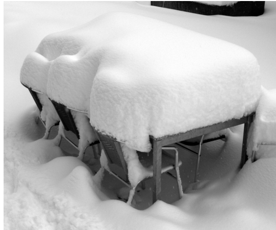
Gartensitzplatz im Winterkleid.

Ein Blick in die Zukunft zeigt, dass die Zentrumspläne der Gemeinde Russikon zu