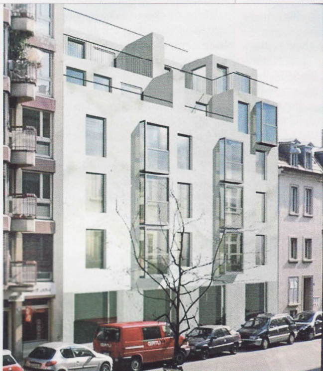
Der fünfstöckige Zwischenbau bietet im vierten und fünften Obergeschoss attraktive Terrassen. Schranktrennwände ermöglichen eine flexible Einteilung der Wohnungen.

terteilt werden. Dieses Konzept trägt unterschiedlichen Lebensformen Rechnung – die grosse Patchworkfamilie könnte beispielsweise auf der Fläche der Fünzimmerwohnung problemlos sechs Zimmer einrichten. Die Holz-Schrankwände sind so konzipiert, dass sie ausreichenden Schallschutz bieten. Das Projekt erreicht den Minergiestandard problemlos und hat gute Möglichkeiten, die Minergie-P-Werte zu erzielen.