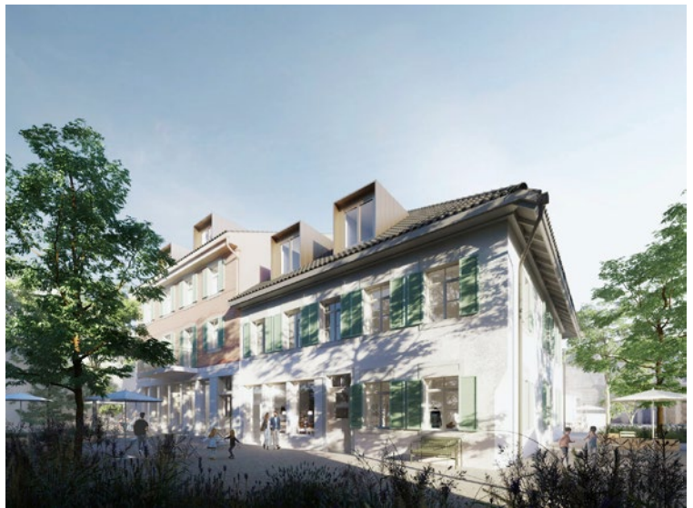
Visualisierung: Skop Architektur &amp; Städtebau

Gewonnen hat diesen das Zürcher Architekturbüro Skop. Laut Jurybericht ist es dem Team gelungen, in den Hofbauten «Baugeschichte zu bewahren, ohne zu konservieren». Das Siegerprojekt besteche durch seine konzeptionelle Klarheit; es sieht für die oberen Geschosse acht Wohnungen unterschiedlicher Grösse vor, darunter Patiwohnungen und eine Maisonettewohnung unter dem Dach. Überzeugt hat die Jury auch das Konzept für